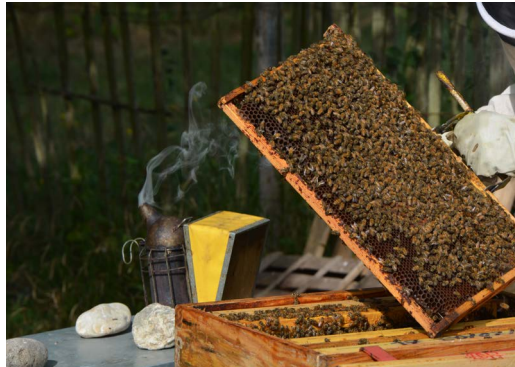
Rucher de la Charmille de Voltaire