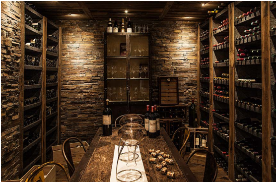
Cave – Jiva Hill