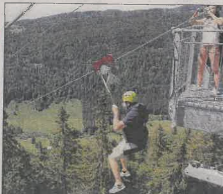
Accrochez-vous, c'est parti monsieur !