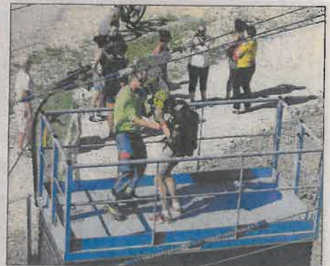
L'arrivée sur l'élévateur où votre équipement vous sera retiré.