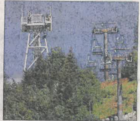
Prise de vue au pied de la tyrolienne.

Photos et vidéos sur le site N°212 et Facebook www.hebdoduhautjura.org