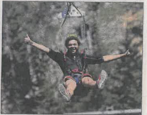
Une fois lancé, profitez, vous êtes « libre comme l'air ».